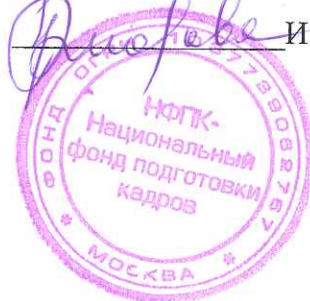
График организации учебного процесса НФПК – Национального фонда подготовки кадров на 2020 год